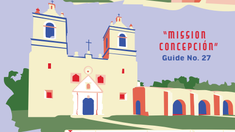
"MISSION CONCEPCIÓN" Guide No. 27