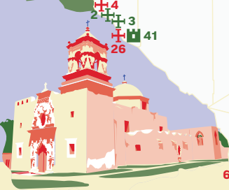
"MISSION SAN JOSÉ" Guide No. 20